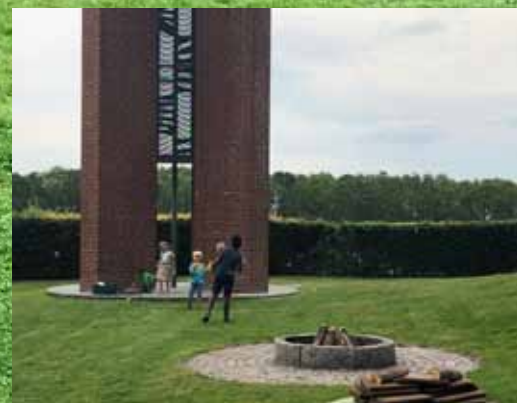
Onsdag den 19. juni var 90 veloplagte børn og voksne til børnegudstjeneste med dåbstræf efterfulgt af grill og bål.